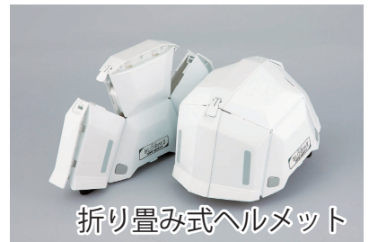
折り畳み式ヘルメット